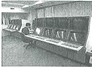
当社 社内設置DCSシステム：一例

東芝社製DCS 横河社製DCS 山武社製DCS エマソン社製DCS 各社PLC計装システム構築 盤・設計製作 計装各種工事